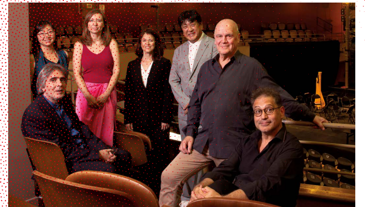
Jury of the 58 th Competition, 2023

The Competition is open to all artists under 35 who wish to become professional conductors, whatever their training or their experience; no previous orchestra conducting diploma is required. A graduate degree in instrumental or vocal practice is required. The Besançon Competition is the only one that does not make a selection based on files (biography or video), but rather on international auditions organized with two pianists and two jury members.