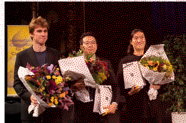
Finalists of the 58 th Competition, 2023