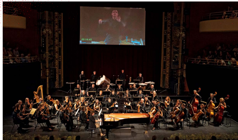
Semi-final Concerto of the 58 th Competition, 2023