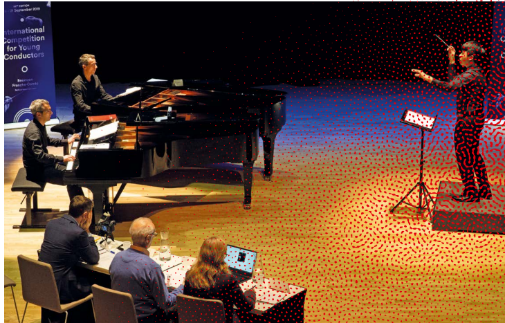
Selection rounds, Besançon, 2019

Fondé en 1951 sous l'égide du Festival de musique de Besançon Franche-Comté, le Concours international de jeunes chefs d'orchestre de Besançon s'est rapidement imposé comme la plus prestigieuse manifestation de sa catégorie. Il est également un des plus complets des concours de direction, avec des épreuves symphoniques, concerto, opéra, et une œuvre en création mondiale.