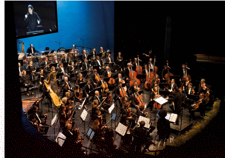
Final of the 58 th Competition, 2023