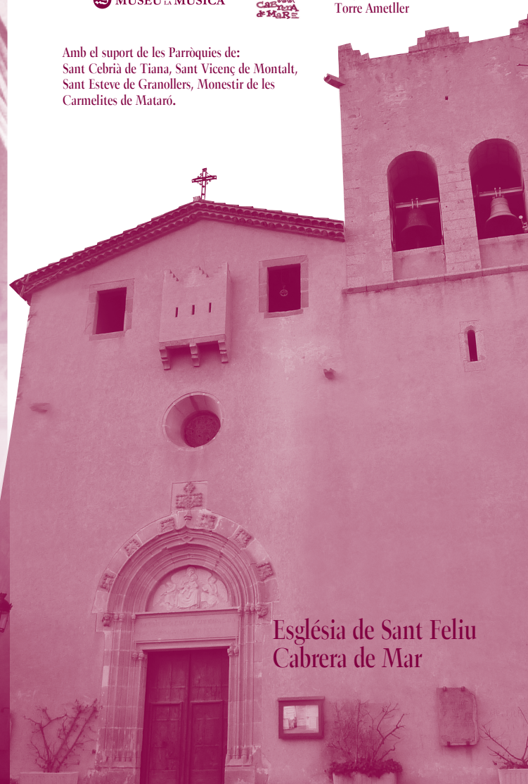
Església de Sant Feliu Cabrera de Mar

Pedal: Subbaix 16' - Baix 8' - Octava 4' - Fagot 16'